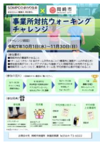
令和7年度配信チラシ