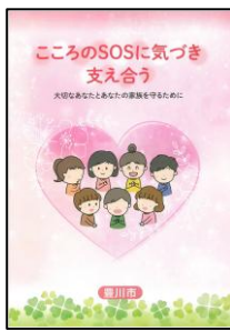
ココロの健康パンフレット