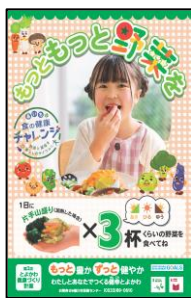
健康づくりポスター例