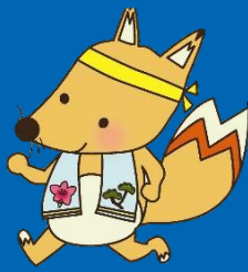
みよし市健康づくり大使 「キューちゃん」