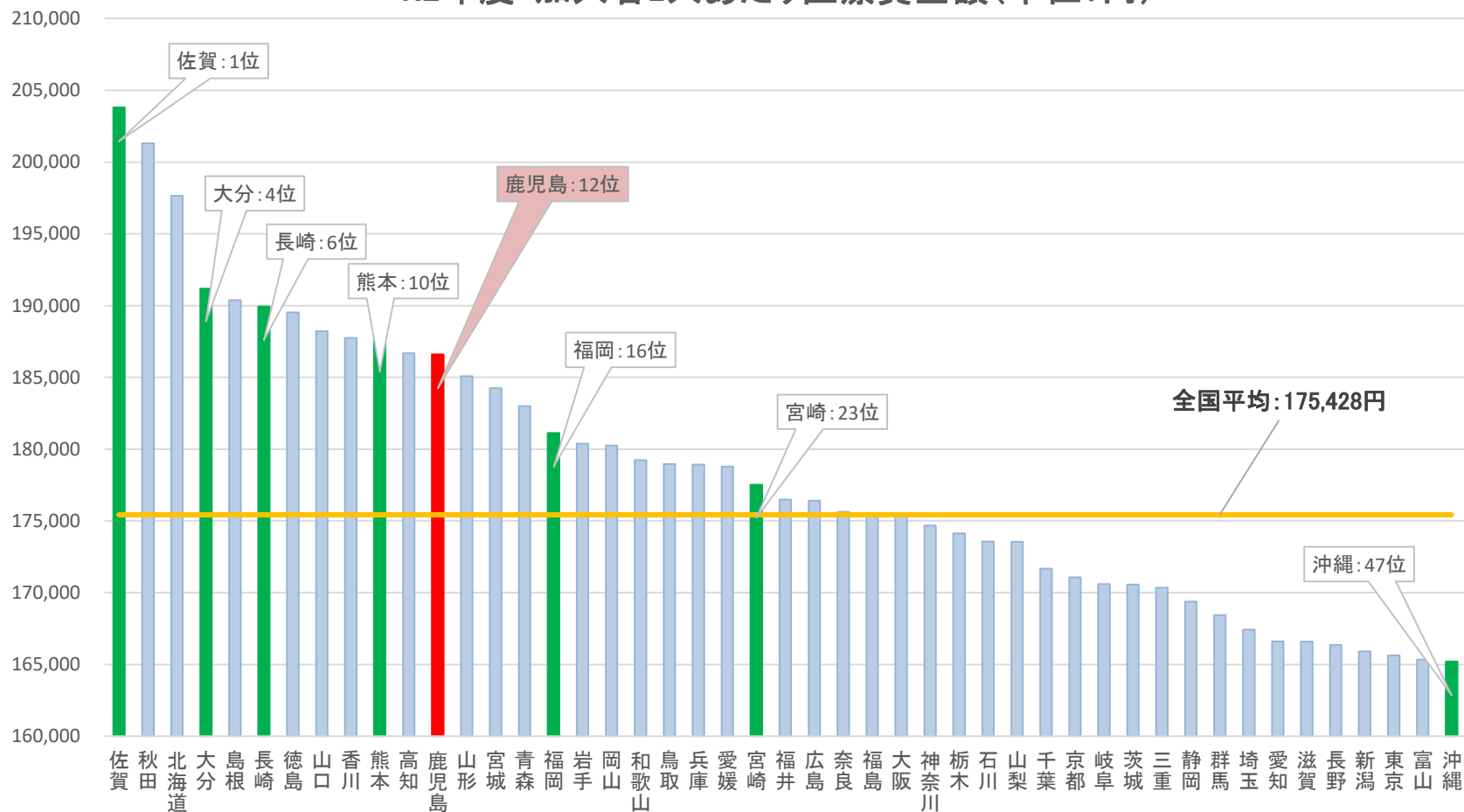
R2年度・加入者1人あたり医療費金額(単位:円)