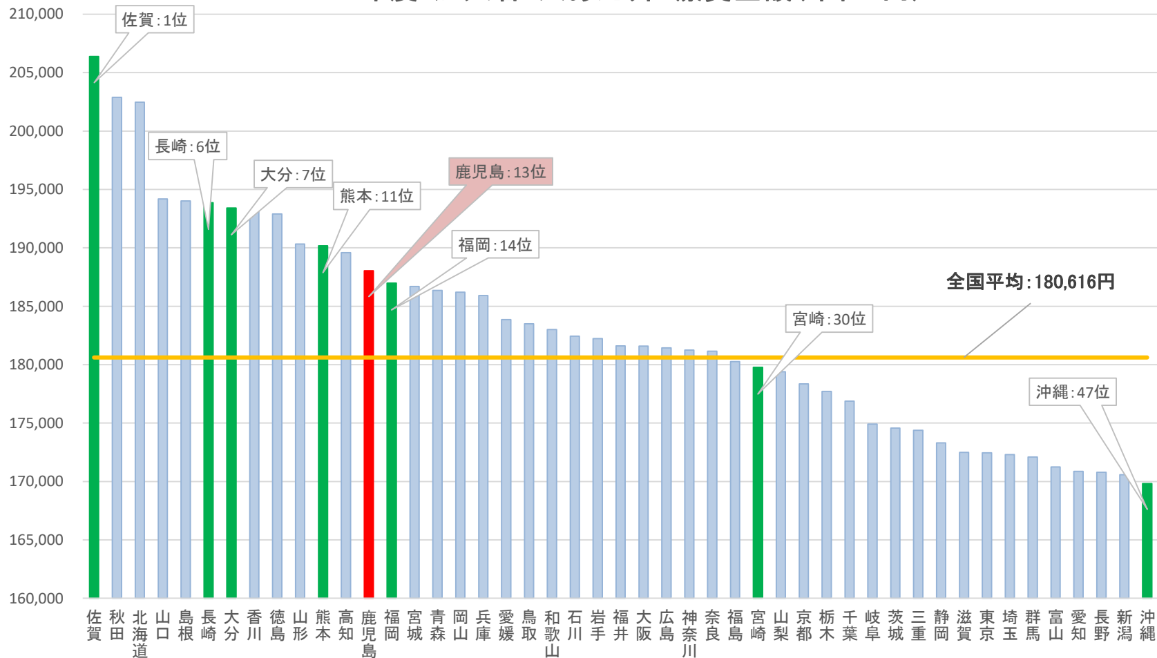
R1年度・加入者1人あたり医療費金額(単位:円)