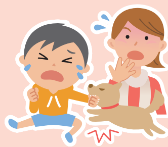
他人の飼い犬にかまれた