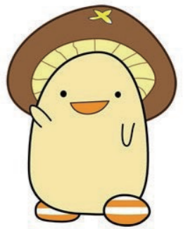
日野町公式キャラクター しいたん

特定健診は、法律で定められた年に一度の健診です。受診方法・受診日を決めて、計画的に受診しましょう！