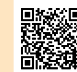
境港市 各種健診・がん検診の ご案内