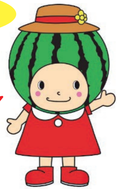
大栄西瓜マスコットキャラクター 夏味ちゃん

大腸がん検診は 医療機関または 集団健診で受診できます！ (自治会ごとの説明会と 回収は行いません)