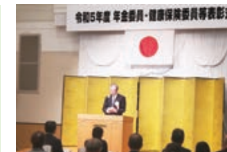
大槻会長あいさつ