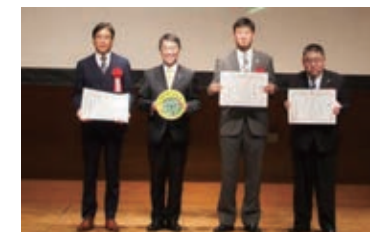
▲健康づくり優良団体表彰 受賞者の皆様