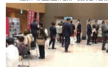
▲応援ブース出展のようす

13企業・団体にブース出展いただき、健康チェック・測定体験や、減塩メニュー提案など、健康づくりに役立つ情報などを紹介いただきました。