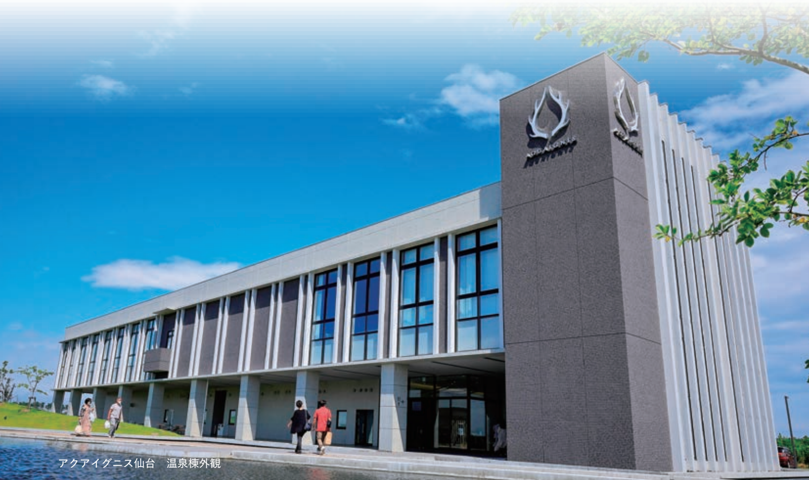
アクアイグニス仙台 温泉棟外観