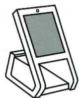
顔認証付きカードリーダー

顔認証付きカードリーダーとは、マイナンバーカード保険証利用に必要となる機器のことで、マイナンバーカードの顔写真データを IC チップから読み取り、その「顔写真データ」と窓口で撮影した「本人の顔写真」と照合して、本人確認を行うことができるカードリーダーです。