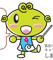
協会けんぽ島根支部キャラクター しまめちゃん

生活習慣病予防健診は日本人のかかりやすい部位を中心としたがん検診もセットになった健診です。