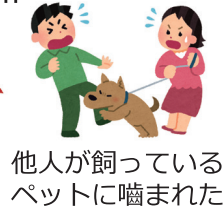
他人が飼っている ペットに噛まれた

私用中の交通事故やケンカなど第三者行為によって負傷した場合、「第三者行為による傷病届」を協会けんぽへ提出する必要があります。