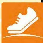
Health Planet Walk