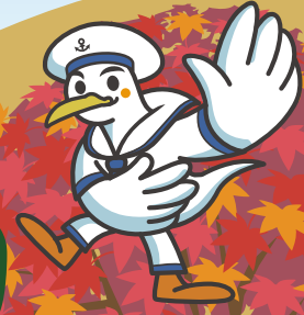
船員保険イメージキャラクター かもめっせ