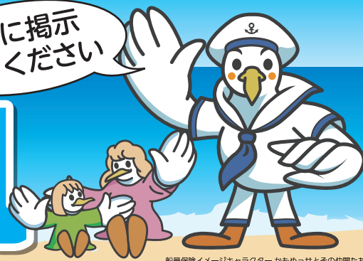
船員保険イメージキャラクターかもめっせとその仲間たち