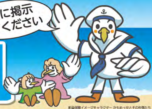
船員保険イメージキャラクター かもめっせとその仲間たち