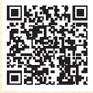
ホームページはこちら

「船員の健康づくり宣言」には、情報提供などのできることから健康づくりを進める シンプルコース と、面談・出前健康講座等がご利用いただける アクティブコース があります。詳細は船員保険部ホームページをご覧ください。