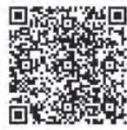
Android Android OS9以降