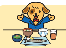
バランスの良い 食生活