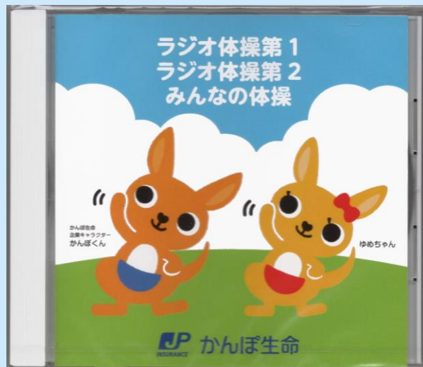
「ラジオ体操第1」「ラジオ体操第2」「みんなの体操」を収録しております。

ラジオ体操は、かんぽ生命の前身である逓信省簡易保険局が1928年に制定した体操で、「いつでも、どこでも、誰でも」手軽に行えることで多くの方に親しまれています。かんぽ生命は、生命保険という事業を通じて社会的使命を果たすために「優先的に取り組む社会課題（マテリアリティ）」のひとつとして、「健康増進等による健康寿命の延伸・Well-being向上」を掲げており、今後ともラジオ体操の普及促進等を通じた取り組みを推進してまいります。