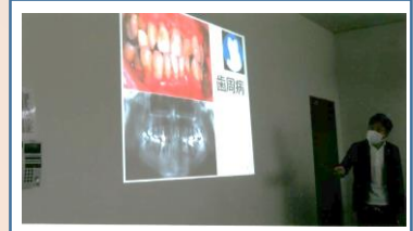
30代の歯周病患者の口腔写真

その中では、国民の80%が罹患していると言われる歯周病が糖尿病と相互に悪影響を及ぼし合うメカニズムや、歯周病の予防法、治療法、日常の歯磨きの方法等について、説明が行われました。