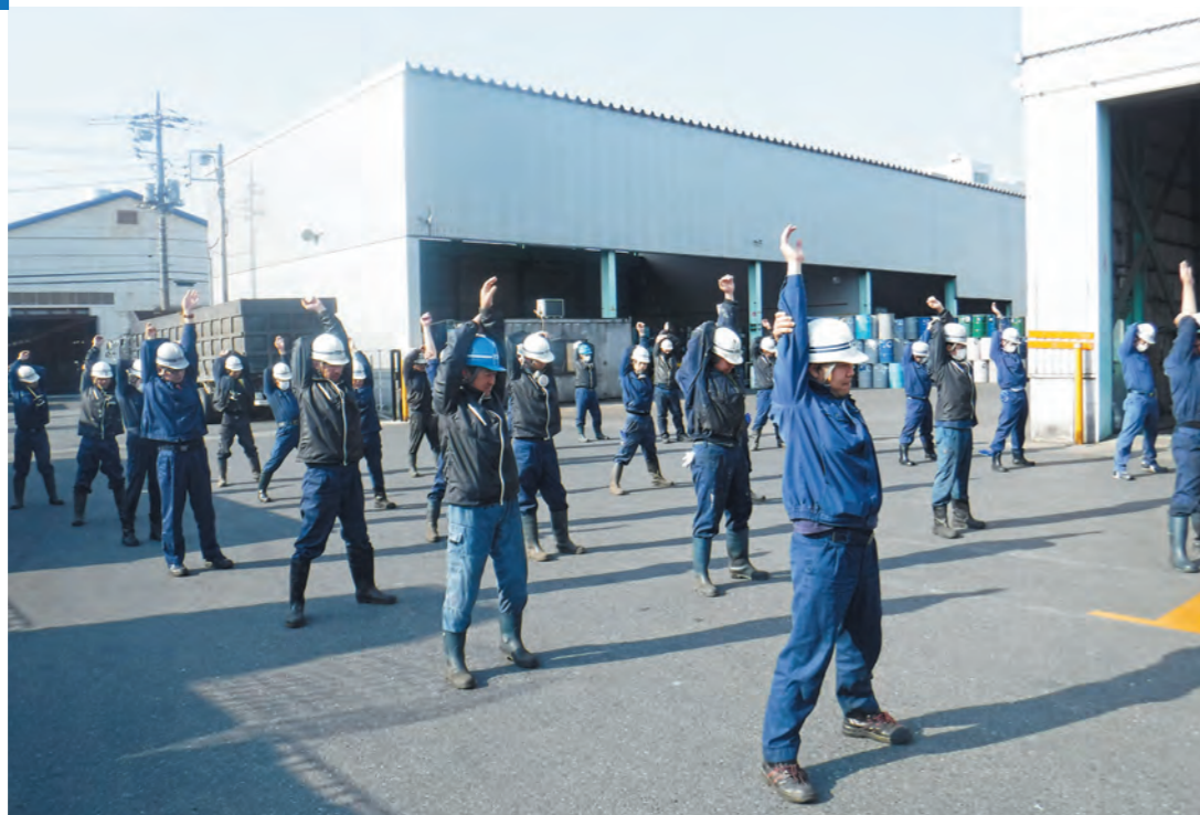
社会に貢献する仕事という矜持を胸に、自然環境を守り日本の産業を支えています。

産業廃棄物の収集運搬及び中間処理、再生重油の製造・販売、エマルジョン燃料の製造・販売、コンクリート剥離剤の製造・販売、メンテナンス事業