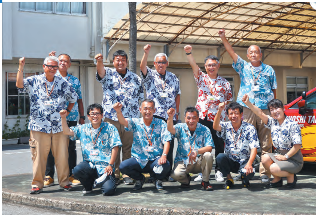
夏期のユニフォームはオリジナルのアロハシャツ！冬期は目の覚めるようなオレンジのブルゾンで、元気いっぱいです！

自動車教習 ペーパードライバー・外国免許切り替え講習、企業安全運転講習、高齢者講習