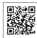
マイナポータル ウェブサイト

A マイナンバーカードを保険証として利用できるように申込をした方については、令和2年度以降に受診していただいた健診の結果をマイナポータルで閲覧できます。詳しくは、マイナポータルのウェブサイトをご確認ください。 ( https://myna.go.jp/html/hokenshoriyou_top.html )