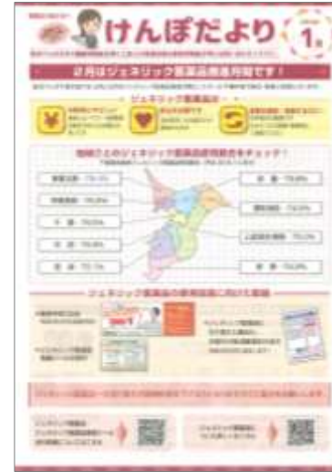
「けんぽだより：1月号」