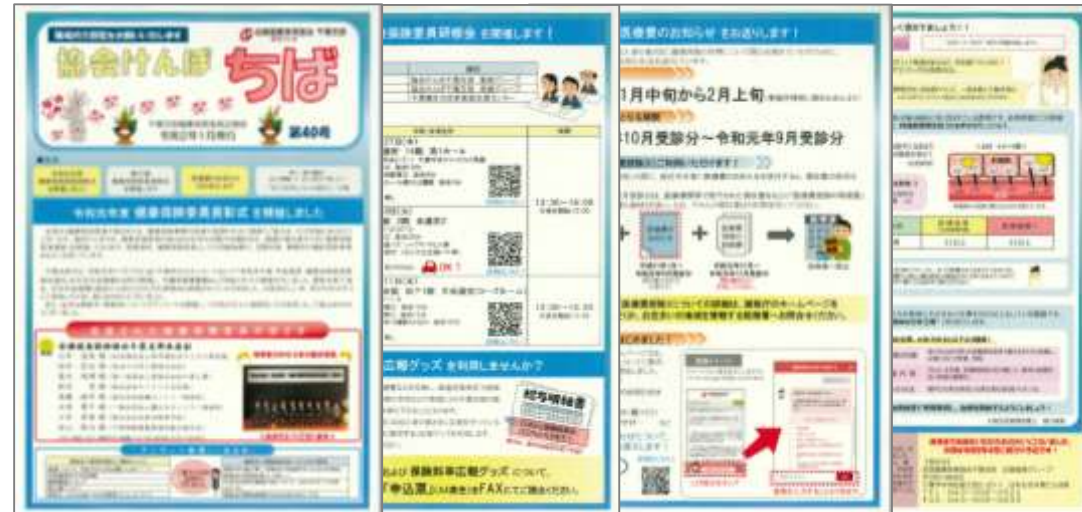
「協会けんぽちば：1月号」