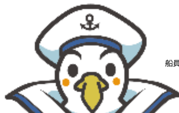
船員保険イメージキャラクター かもめっせ