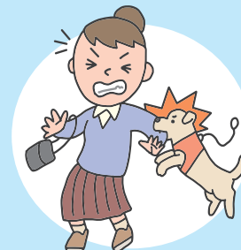
飼い主がいる動物にかまれた場合