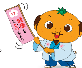
健康城主 けんわか君

この一覧は令和6年度当初の情報です。協会けんぽ和歌山支部ホームページに最新の情報を掲載しています。