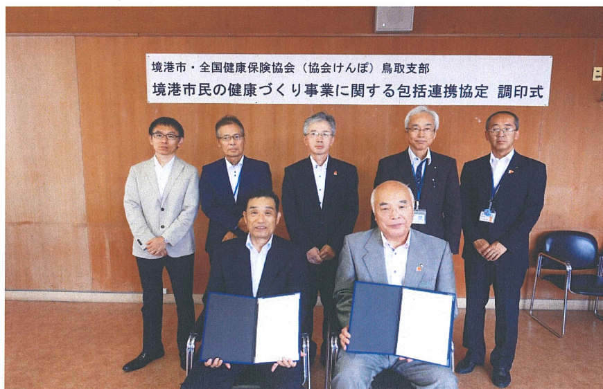
関係者で記念撮影