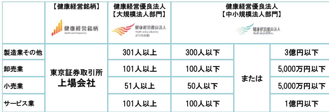
<健康経営に係る顕彰制度の対象法人>

特に優良な健康経営を実践している大企業や中小企業等を顕彰する「健康経営優良法人認定制度」を経済産業省と日本健康会議が共同で創設しています。規模の大きい企業や医療法人を対象とした「大規模法人部門」と、中小規模の企業や医療法人を対象とした「中小規模法人部門」の2部門があり、これらに加えて、令和2年度より、健康経営優良法人の中小規模法人部門の中から、「健康経営優良法人の中でも優れた企業」かつ「地域において、健康経営の発信を行っている企業」として優良な上位500法人に対して新たに「ブライツ500」の認定が始まりました。令和4年3月には、埼玉支部加入の4事業所が「大規模法人部門」、186事業所が「中規模法人部門」、9事業所が「ブライツ500」に認定されました。