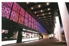
みらい長崎ココウォーク内 TOHOシネマズ長崎