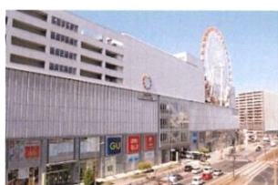
長崎県長崎市茂里町1-55

令和2年11月20日から12月17日までの1か月間上記ジェネリック医薬品使用促進CM（15秒）を、ユナイテッド・シネマ長崎（アミュプラザ長崎）TOHOシネマズ長崎（みらい長崎ココウォーク）の2劇場にて、劇場版「鬼滅の刃」～無限列車編～の上映前に放送しました。2館合計の上映回数は643回、観客動員数は32,075人となりました。