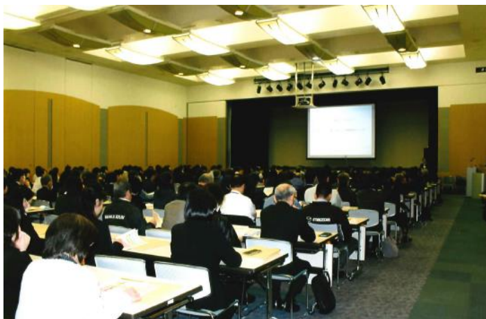
※昨年度の実施風景

【研修内容】 ◆挨拶および「健康経営」について ◆働き方改革関連法およびパワーハラスメント対策の義務化等について