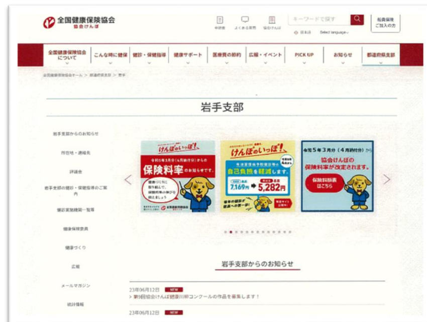
岩手支部Webサイトトップ