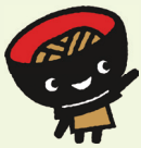
わんこぎょうだい そばっち