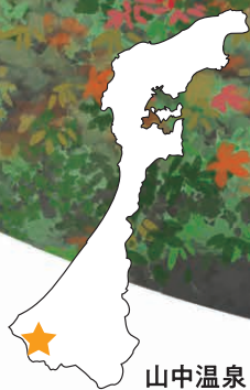
山中温泉 こおろぎ橋