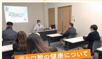
歯と口腔の健康について