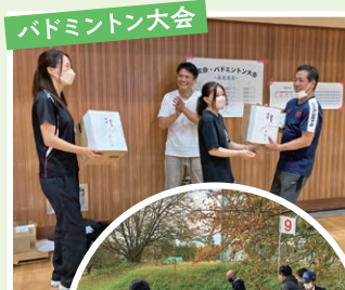
バドミントン大会