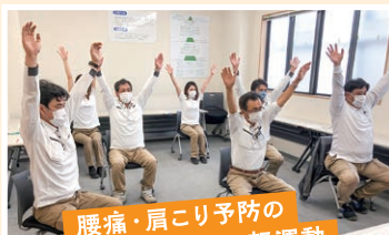
腰痛・肩こり予防の ための軽運動

当初は、「工作中に健康セミナーなんて(それよりも目の前の仕事を)」という声もありました。しかし、「かがやき健康企業宣言」によって、社内に少しずつ健康経営の重要性が浸透していき、いまでは経営側も「ぜひやって」と後押ししてくれる雰囲気です。休日に健康セミナーを企画するとなかなか従業員が集まりにくいという悩みもありましたが、就業時間中に実施することで、 より多くの従業員に参加してもらえるよう になりました。