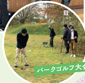
パークゴルフ大会