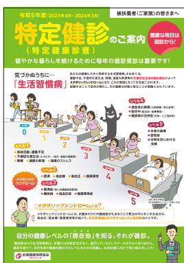
パンフレットなど