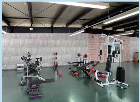
社内トレーニングルーム

健康診断等について、社員の受診に対する意識が高くなり各種健(検)診を自ら希望して受診するようになりました。また、所見のあった社員の再検査等の受診率も高くなりました。社内トレーニングルームの利用率も高く、健康増進を図っています。更なる健康増進のため、新たな機器の増設をしていきます。