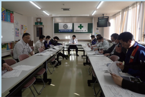
安全衛生委員会の様子