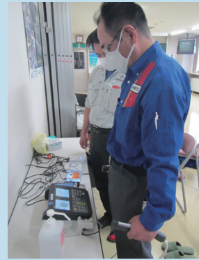
体組成測定の様子 (むつ市実施の健幸アップ事業)

健康意識は年々高まっており、「N-NOSE」の実施で個人の意識はさらに改善されました。市の健幸アップ事業への参加や、有給休暇を取得しやすい環境をつくることにより、従業員の疲労回復やリフレッシュにつながっています。