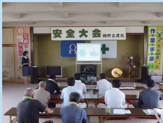
「心の健康づくり」講習を受講している様子

生活習慣病予防健診の内視鏡検査により、病変が見つかり、早期の治療が行われ職場復帰した従業員や、歯科健診がきっかけで歯の健康にも興味を持ち、気を配るようになった従業員もいました。