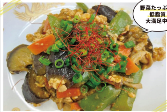
野菜たっぷり 低脂質! 大満足中華