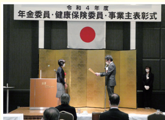
厚生労働大臣表彰