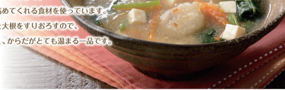
カロリー (1人分): 134kcal 塩分 (1人分): 1.3g

喉の炎症をやわらげて、 免疫力も高めてくれる食材を使っています。 れんこんと大根をすりおろすので、 食べやすく、からだがとても温まる一品です。