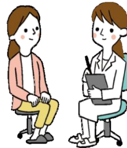
年1回の健診受診 保健指導の実施