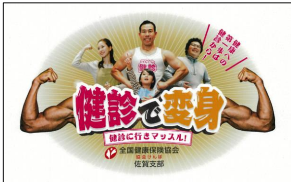
広報物のイメージ(令和5年度)